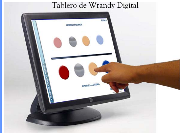
Tablero de Wrandy Digital