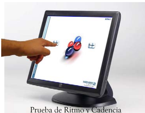
Prueba de Ritmo y Cadencia

Moveo Test V2.0 es un aplicación desarrollada con los más altos estándares de calidad así como con la tecnología más moderna, Moveo Test V2.0 utiliza la tecnología Touch Screen (pantallas con tecnología sensible al tacto) con la cual hace un sistema fácil de usar ya que no es necesario que el evaluado requiera destreza en el uso de equipos de computo, ya que las pruebas son presentadas oprimiendo las respuestas en el monitor Touch Screen.